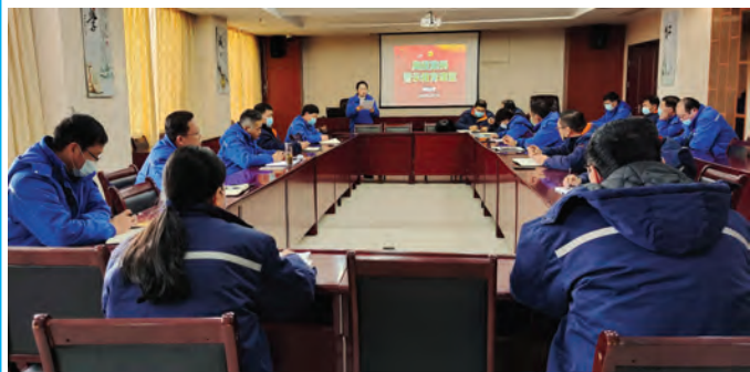
新年伊始,为了确保风清气正庆新春,利海化工公司纪检多项举措上好新年廉政警示教育第一课。1月17日,组织中高层正职以上党员干部24人开展典型案例警示教育,并与中层管理人员以及重点岗位人员签订廉洁承诺书,开展节前谈心谈话。(梁娴)

重学习。 节前开展警示教育。要求各单位组织党员干部,集中观看《警钟长鸣》《不可逾越的底线》等警示教育片;通报公司近期典型违规案例,进一步严明纪律,强化警示教育,不断传导正风肃纪压力,推动徐圩政治生态海晏河清,以优异成绩迎接党的二十大。(陈健 王岩)