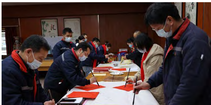
新春佳节将至,为弘扬廉洁文化,营造欢乐祥和的节日氛围,氨纶公司党委举办以“述廉、写廉、送廉”为主题的“迎新春、过春节、送祝福”文化活动,开展节前提醒谈话,递交廉政承诺书,观看廉洁视频。部门负责人代表用各种字体书写“廉”字,坚定干净担当,勤政廉洁的决心。(矫春艳)