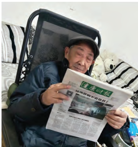
台北投资公司为了让老干部及时了解掌握党和国家的方针政策,进一步丰富他们的精神文化生活,根据自身特点,为 13 名离休老干部订阅了《健康时报》《银潮》等刊物。(栾慧中)