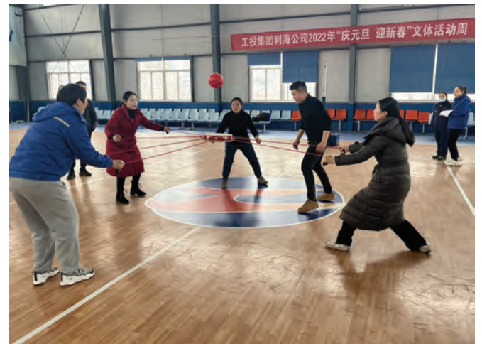
1 月 11 日至 14 日,利海化工公司举办“元旦迎新春”文体活动周系列活动,全体职工在同心击鼓、抖乒乓球、背靠背夹球跑、掷蛋、摸石头过河等 7 个比赛项目中收获欢乐和幸福,为跨入新的一年奏响一曲和谐乐章。图为同心击鼓比赛现场。(王静静)